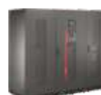
UPS MASTER HP 100 - 600 kVA