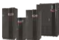
UPS CES SIGMA 10 - 500 kVA