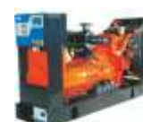
AGREGATY PRĄDOWÓRCZE 5 - 1500 kVA