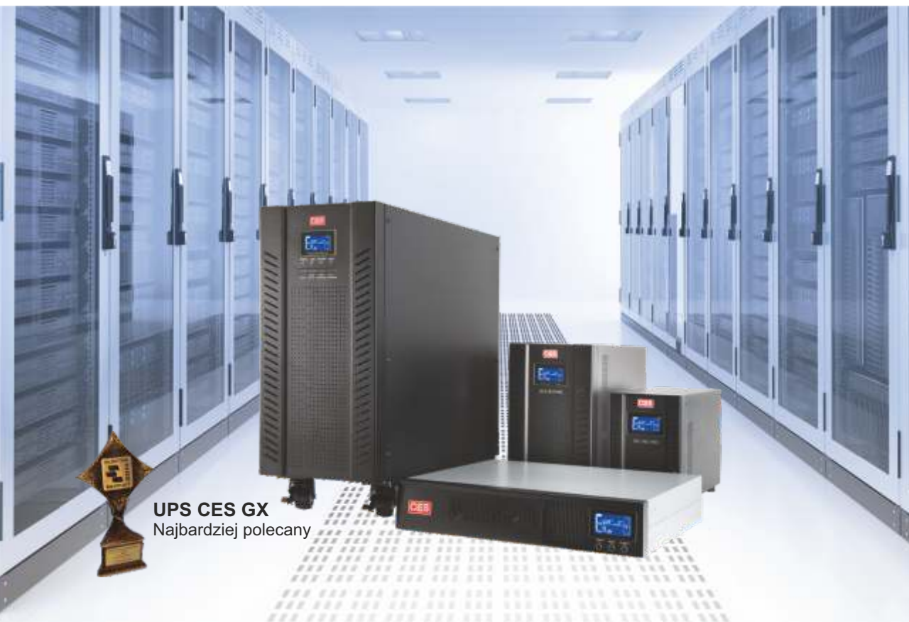
UPS CES GX Najbardziej polecany